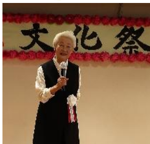
社会福祉法人清和会 理事長

10月17・18日に文化祭を開催し、多数の方にご来館いただきました。クラブ員の日頃の練習成果の発表の場として展示の部、演芸の部ともに大盛況でした。ご協力ありがとうございました。