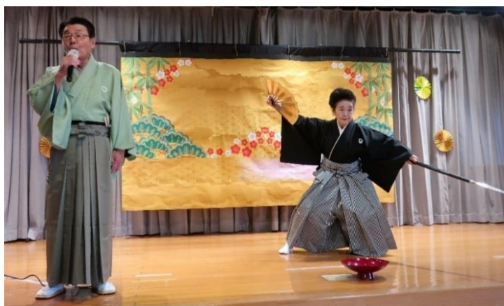
詩吟・舞踊講師 コラボ企画 「黒田武士」