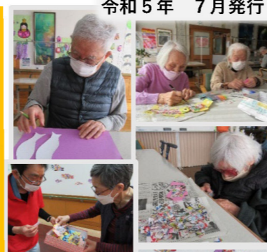
ちらしを使って鱈を作りました