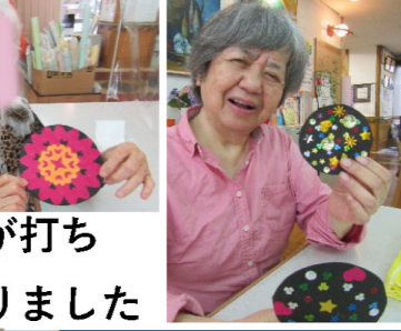
花火が打ちあがりました