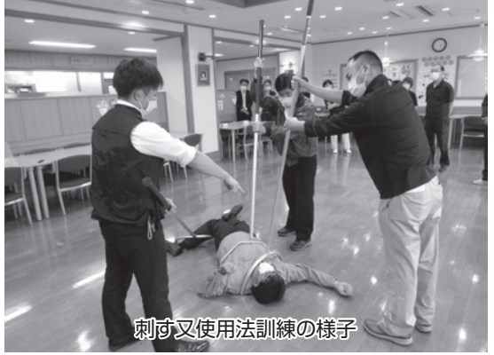
刺す又使用法訓練の様子

令和4年1月22日に、船橋東警察署 生活安全課係長会員のものと、第2ワールドナッシングホーム、ケアハウス市立船橋長寿園、二宮飯山満在宅介護支援センター、船橋市ケアハビリセンターの4つの事業所合同で不審者対応訓練を行いました。当日は、2名の警察職員の見守りにより「不審者が侵入してきた」という設定で、通報訓練、防犯訓練、刺す又使用法訓練を行いました。防犯訓練で大切なのは、乗客が不審者なのか、早くに見極め、組織で対応することです。警察に通報してから警察官が到着するまで、平均で8分から10程度かかるそうです。警察官が到着するまでの10分間は、現場にいる職員が対応しなければなりません。非常時に何をしなければならぬか、各自、役割をしっかりと把握し、訓練時以外もイメージトレーニングをすると良いそうです。刺す又使用法訓練では、刺す又の持ち方・構え方について指導頂き、使用時のコツも教えて頂きました。使用方法を誤れば、刺す又を有効に使用する事が出来ただけでなく、不審者に刺す又を取られ攻撃される可能性すらある事も学ぶ事が出来ました。今回の訓練も、船橋東警察署のご協力とご指導により、実践的な訓練を行うことが出来ました。ありがとうございました。