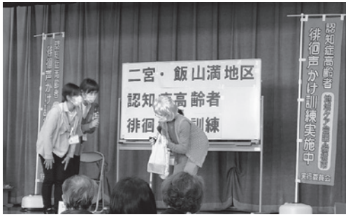
前原地域包括職員による徘徊高齢者の声掛け保護の寸劇

船橋中央ライオンズクラブからは、清和会に対して毎助成金をいただいております。清和会は高齢者福祉のために助成金を大事に使わせていただいております。紙面をお借りして、船橋中央ライオンズクラブの会員の皆様から御礼申し上げます。ありがとうございました。